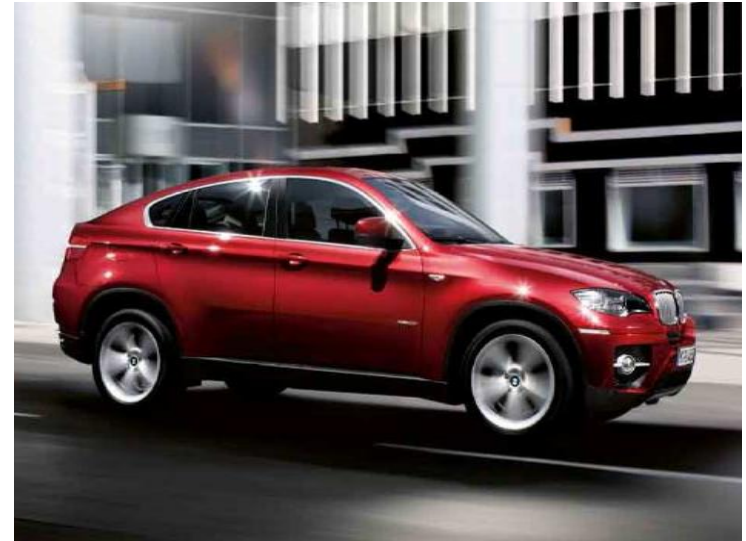
X6 xDrive30d X6 xDrive40d