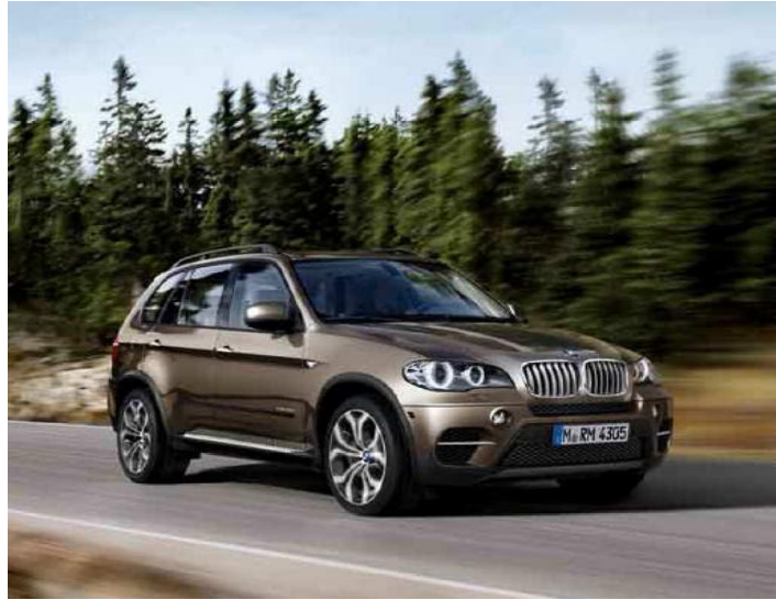
X5 xDrive30d X5 xDrive40d